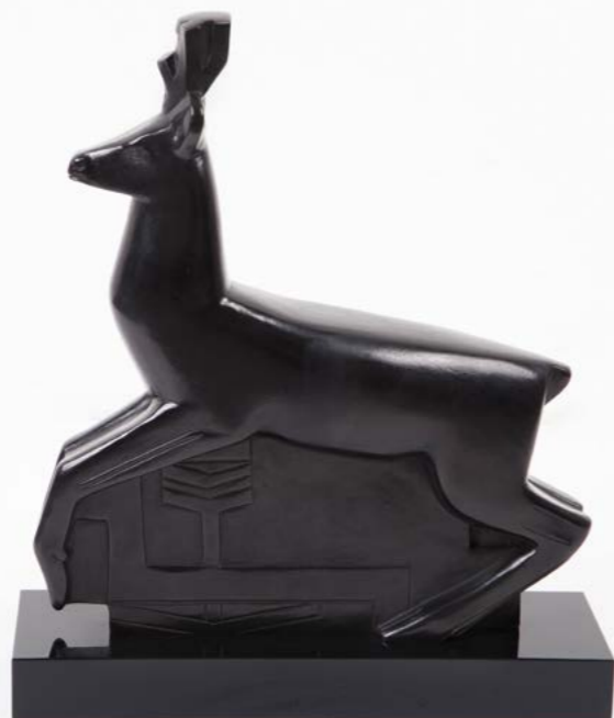
JOSEPH CSAKY (1888-1971) Chevreuil , 1926 H. 29 cm Sculpture en bronze Cachet de la fonderie CAI, estampillée AC (Atelier Csaky), signée et numérotée 4/8 Porte la date de fonte 2016