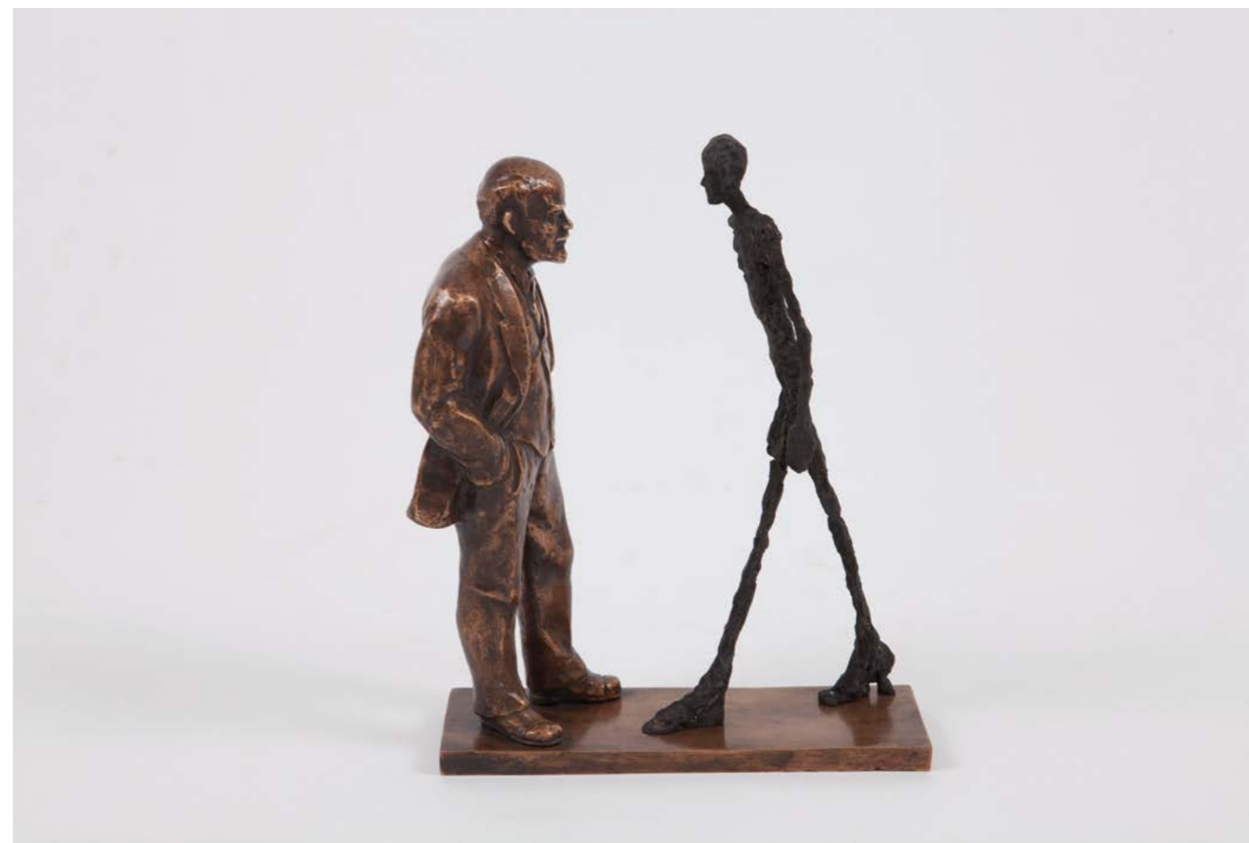
LEONID SOKOV Meeting of two Sculptures Lenin Giacometti , 1997 21 × 23,5 × 8 cm Sculpture en bronze Fonderie Salvadori Arte, Italie, n°VI/XII Signée et datée