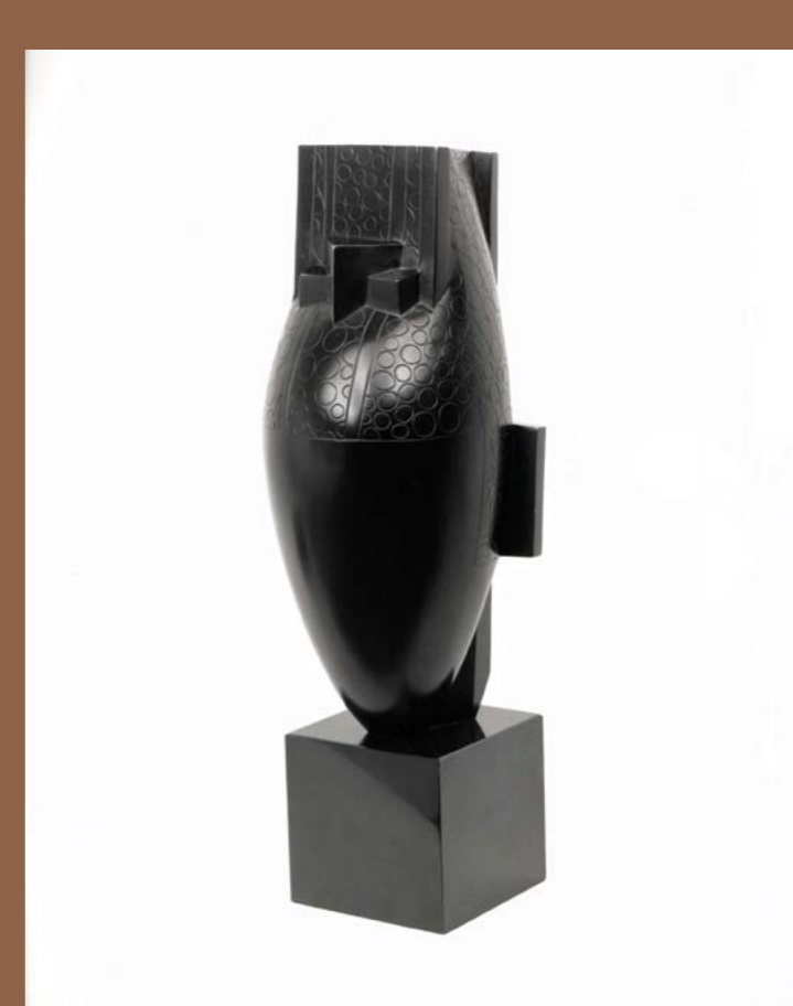
JOSEPH CSAKY Figure perlée H. 31 cm ; base : 5 × 5,5 cm Plâtre original Signature monogramme