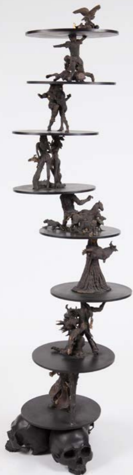
STÉPHANE PENCRÉAC'H La Tour sans Fin , 2014 158 × 50 × 50 cm, Bronze patiné Fondeur: Bocquel Pièce unique