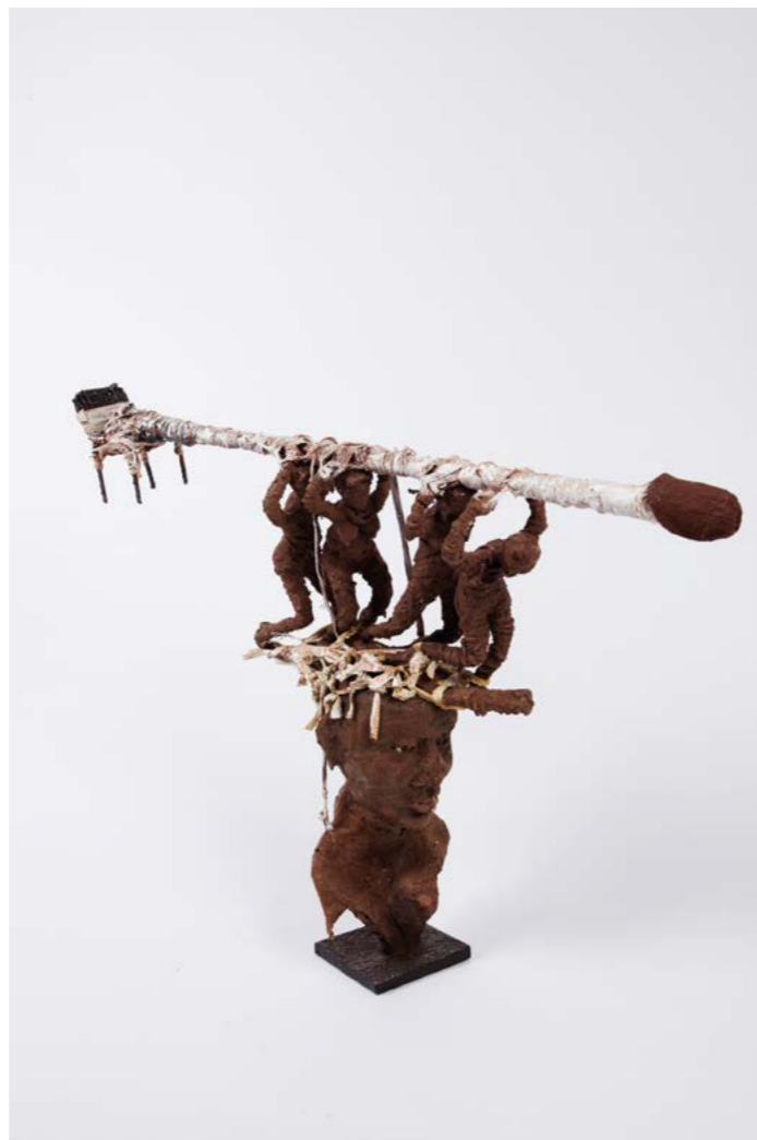
RICHARD KORBLAH Dignité bafouée , 2015 Technique mixte 84 × 100 × 23 cm